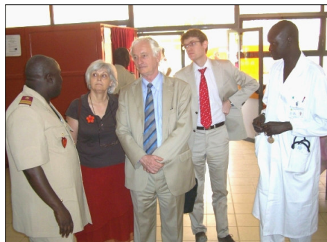
L'unité d'imagerie par résonance magnétique (IRM), le Service d'Accueil des Urgences, la Fédération des Laboratoires et le chantier du nouveau service de psychiatrie ont aussi été visités