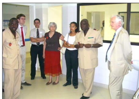
puis au Centre d'Explorations fonctionnelles, aux chantiers des services de réanimation et des blocs opératoires