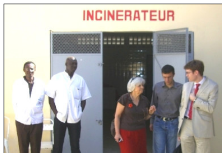
A la Case des Tout-petits, au service de Pédiatrie, à la pharmacie hospitalière, à l'incinérateur