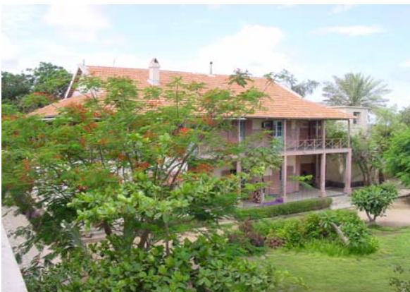
Pavillon Boufflers (médecine)

Médecine Interne Cardiologie Hépatogastroentérologie Maladies infectieuses Pédiatrie Psychiatrie Pneumologie