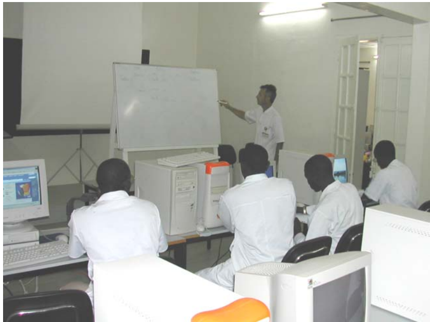
La Cellule Formation de l'HPD