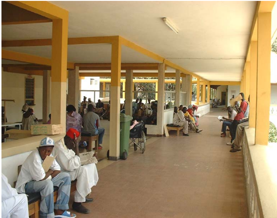
Salle d'attente du Bloc Opératoire

Le livret d'accueil qui vous est remis vous donne les renseignements utiles sur les différents services de l'hôpital, sur les conditions et facilités de séjour et sur les règles à respecter dans l'intérêt de tous. La charte du patient hospitalisé, qui reprend les droits essentiels des patients accueillis dans un établissement public de santé, ainsi qu'un questionnaire de sortie sont annexés à ce livret. Vous pouvez demander à consulter le règlement intérieur de l'hôpital ou vous le procurer au bureau des entrées.