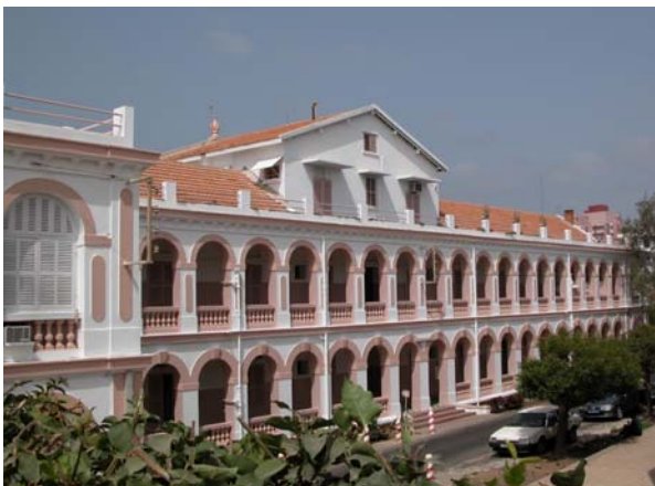
Bâtiment St Louis (Maternité Gynécologie)

Chirurgie orthopédique Chirurgie viscérale Chirurgie viscérale maxillo-faciale, plastique et stomatologie, cabinets dentaires Chirurgie urologique Ophtalmologie Oto-rhino-laryngologie Maternité