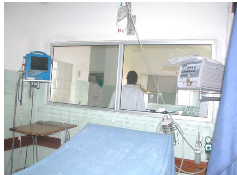
Chambre de réanimation médicale