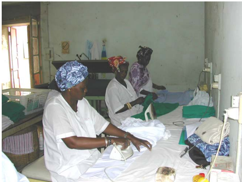
La Buanderie de l'HPD ( repasseuses au travail )