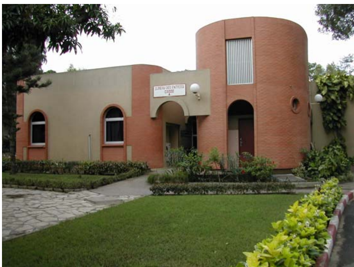
Bureau des Entrées ( SHSE )

NB : VOUS N'AUREZ RIEN A PAYER SI VOUS DISEPOSEZ D'UNE PRISE EN CHARGE TOTALE D'UN ORGANISME OU D'UN TIERS PAYANT.