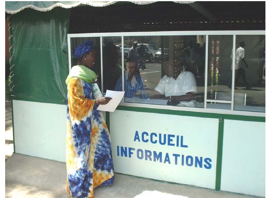
Centre d'accueil et d'Informations aux visiteurs

Capable d'assurer l'accueil des urgences médico-chirurgicales par le large éventail des spécialités exercées et un plateau technique performant (imagerie médicale, centre d'explorations fonctionnelles, laboratoires, réanimation, bloc opératoire), l'Hôpital Principal de Dakar offre aux malades une prise en charge de qualité dans le respect de la tradition d'hospitalité et de rigueur de son personnel.