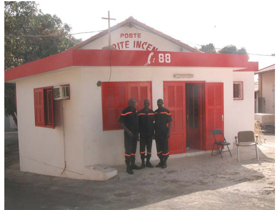
L'équipe de la sécurité incendie devant leur local