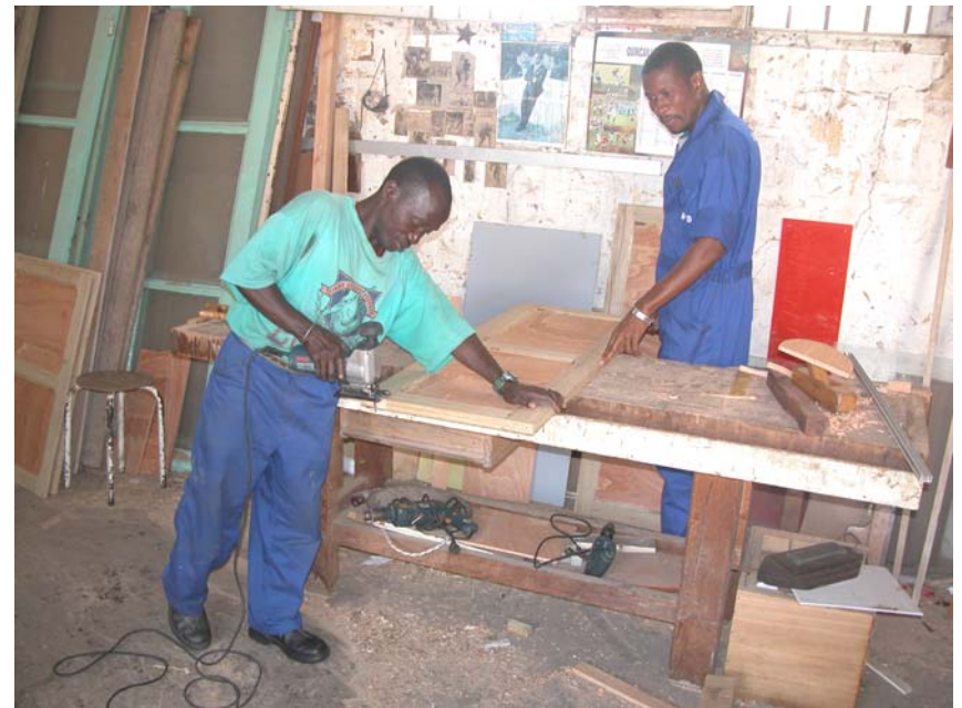
Atelier de menuiserie