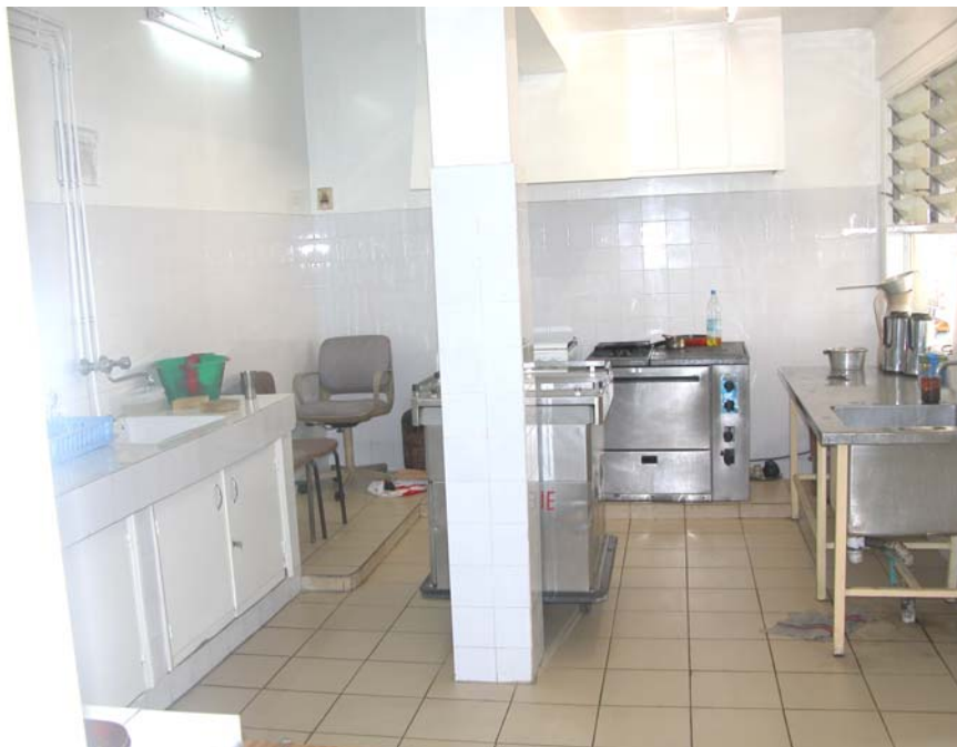
Cuisine clinique Brevié

Horaires de distribution : 8H 00 - 12h 00 - 18h 00