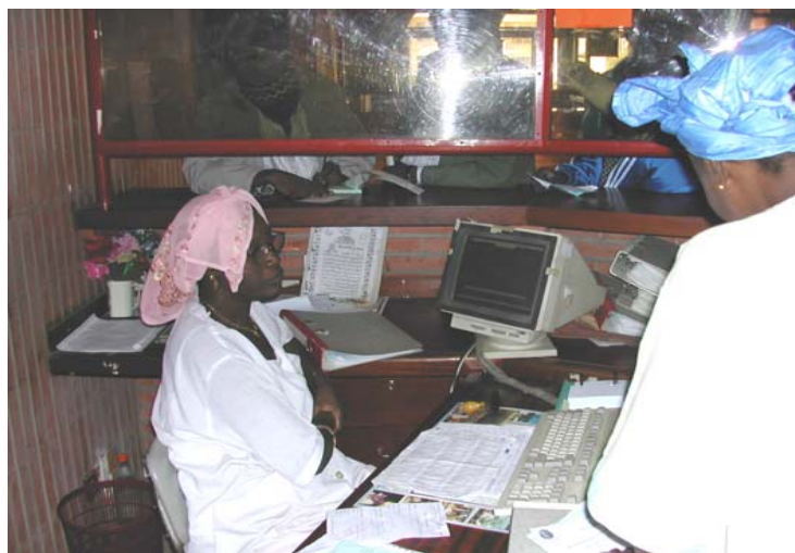
Service des Hospitalisations et des Soins Externes ( SHSE )