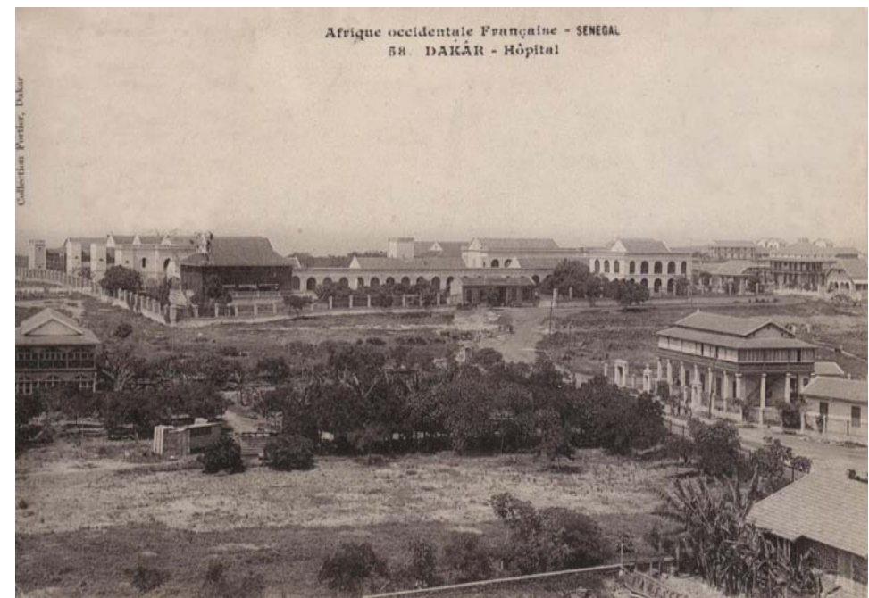
Hôpital Principal en 1906

Hôpital Militaire Colonial dans un premier temps, il est placé en 1971 sous la double tutelle des Forces Armées Sénégalaises et de la République Française. Enfin à la suite de la nouvelle convention de coopération Franco-Sénégalaise signée le 24 décembre 1999, l'Hôpital Principal de Dakar passe au 1 er janvier 2000 sous l'Autorité Sénégalaise, la France continuant une aide technique sur une durée de cinq ans, renouvelable le cas échéant en 2005.