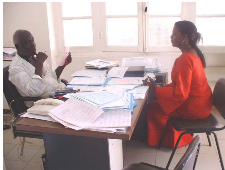
Entretien d'un accompagnant au près du major administratif

Vous devez vous munir d'une pièce d'identité civile ou militaire, de votre carnet de santé et prévoir les documents suivants selon votre cas :